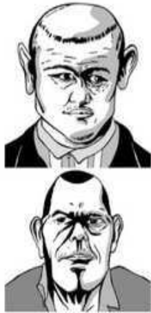
Criminoso Nato - C. Lombroso

Lombroso, após estudos feitos em indivíduos que cometeram crimes (vivos e mortos), mais de quatrocentas autópsias em criminosos e analisando mais de seis mil delinquentes vivos - todo esse trabalho com o objetivo de encontrar características físicas e psicológicas que diferenciasssem o indivíduo criminoso nato, por paixão, loucos e de ocasião, do não criminoso, traçou as suas características fisionômicas, a exemplo, o quadro comparativo relativo à íris: